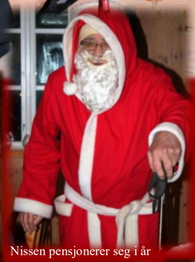
Nissen pensjonerer seg i år