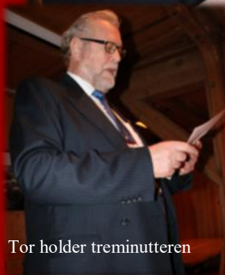
Tor holder treminutteren