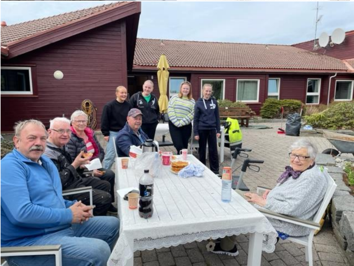
Bildet over fra 7.mai da vi fikk uventet hjelp fra årets konfirmanter 😊