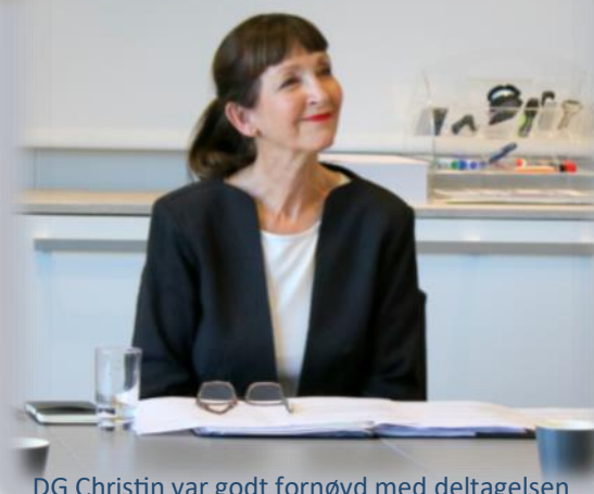
DG Christin var godt fornøyd med deltagelsen