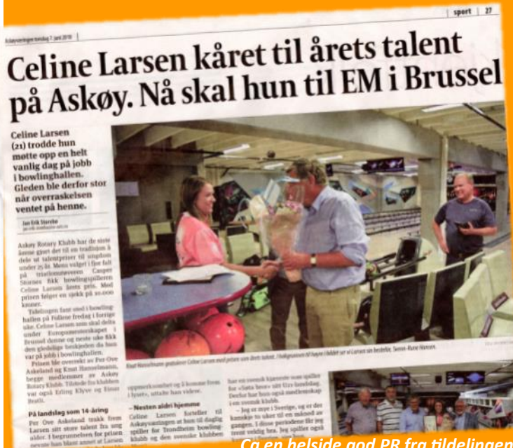
Cå en helside god PR fra tildelingen

Askøy Rotary Klubb har i mange år delt ut en talentpris til en ungdom som har imponert både journalister og folk flest. Prisen er en del av klubbens satsing på ungdom og det er en del av klubbens mediestrategi. Slik er kriteriene for prisen: