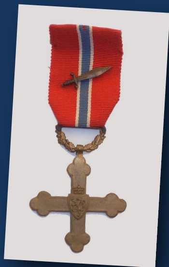
Krigskorset med sverd