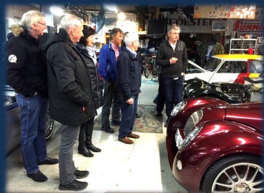
Mye nostalgi her

Jaguar er et annet bilmerke basert på engelsk design og håndverk. Bedriften startet som SS Cars Ltd i 1922. Navnet ble Jaguar i 1945. Eies i dag av et indisk selskap Tata Motors. Bilen er bygget for å vise oppsikt. Antall hestekrefter ligger mellom 300 til 500 alt etter modell. Prisen starter på 1,5mill kr og stiger raskt. Også et bilmerke som er blitt benyttet i engelske filmer for å vise engelsk storhet.