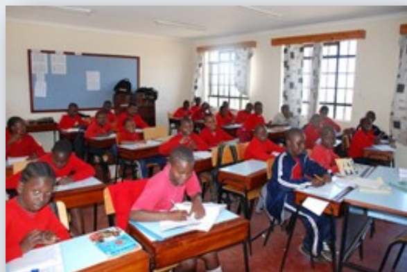
Her utvikles både kunnskap, livsglede og mestring

Landsbyen er etablert som en stiftelse som er registrert i Norge slik at de ikke kan få noen innblanding fra lokalt hold med tanke på drift og forvaltning av midler.