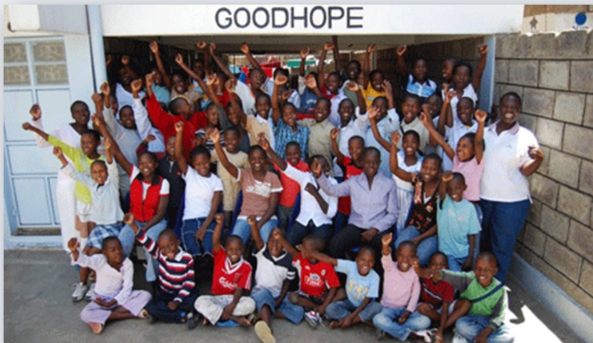
Bilde fra åpningen av Good Hope i 2009 der det da var investert 10 mill. kroner