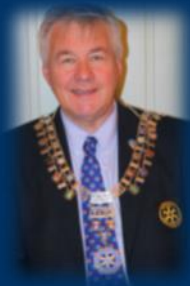
DG Arild Dale