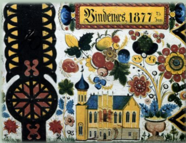
Fig. 1. Kiste frå Vindenes i Fusa, måla i 1877 av Annanias Tveit, med bilete av Lysøen under fargerike roser.

På framsida av den vesle brosjyren om rosemålarverkstaden er det eit bilete av Lysøen under fantasifulle roser som veks opp frå ein blomevase. Dette er ei av Annanias Tveit