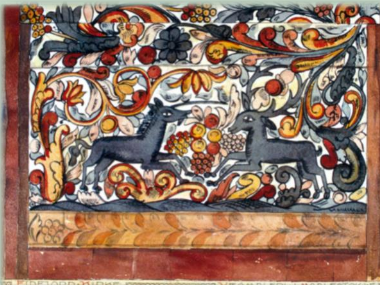
Fig. 3. Korskillepanel i Eidfjord kyrkje, måla kring midten av 1600-talet av ein laugsmålar frå Bergen, med framstilling av sentrale symbolmotiv i mellomalderens kyrkjekunst: einhjørningen og hjorten. Einhjørningen er eit bilete på Maria og jomfru-fødselen; den springande hjorten er eit dåpssymbol henta frå Salme 42 i Det gamle Testamentet: «Som Hiorten tørster efter det Friske Vand Saa tørster ogsaa min Siel efter Den Hellige Aand».

Maurset, der dei overnatta og tok seg vidare til Høl og ned Måbøberget og til Eidfjord. Der kan dei ha vore innom Eidfjord kyrkje og sett korskillepanelet måla midt på 1600-talet,