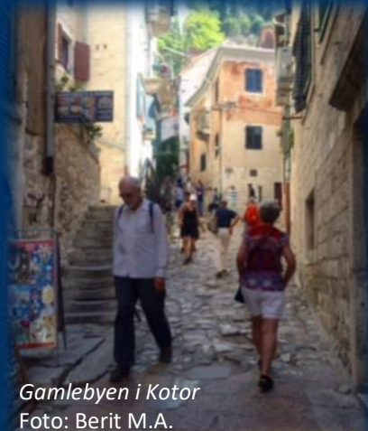
Gamlebyen i Kotor

inn i Albania så vi også de triste sporene etter flyktningestrømmen fra Hellas i form av plastposer og søppel som de ikke hadde funnet andre steder å legge. Men flyktninger så vi ikke.