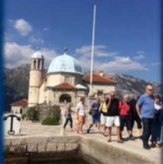
Our Lady on the rocks.

Vi var borte i åtte dager og busset oss innom fire forskjellige land med fire forskjellige valutaer. Med base tre dager i Kroatia og fem i Montenegro kunne man slik sett si at turen var rolig, men ville du være med på utfluktene, og det ville de fleste av oss, var det dager så fulle av inntrykk og informasjon, at mange av oss følte at vi kunne trenge en ukes hvile da vi kom hjem igjen!