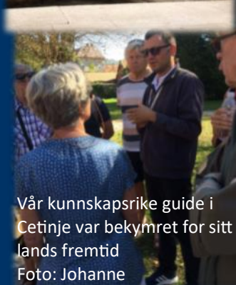
Vår kunnskapsrike guide i Cetinje var bekymret for sitt lands fremtid