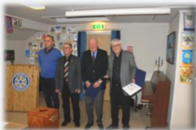
PHF til to i Karmøy Vest