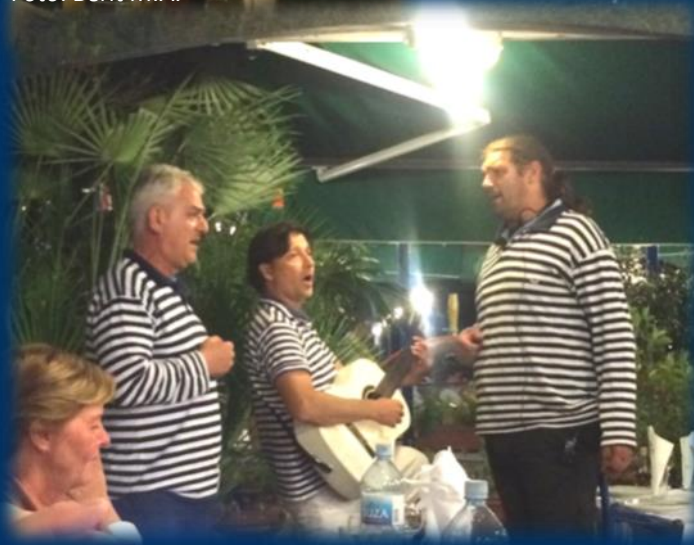
Underholdningen i restauranten «Jadran» var det tre røslige sangere som sto for.