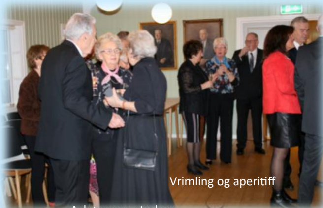
Vrimling og aperitiff

Askøy Rotary klubb ble etablert i 1979 og har charterdato 27. desember 1979. 27. desember 2019 fylte klubben med andre ord 40 år. Torsdag 20. februar ble jubileet feiret i Møllesalen i Shoddyen i Strusshamn med 35 medlemmer, ledsagere og gjester til bords.