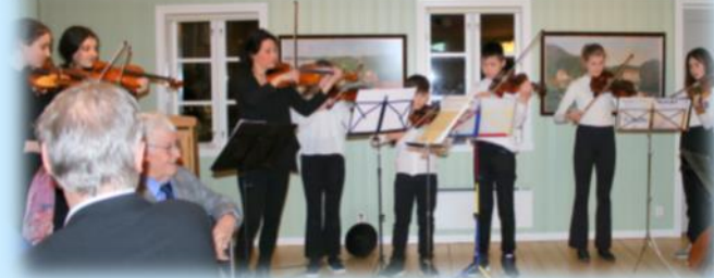
Askøy unge strykere

Arrangementskomiteen hadde laget et verdig og flott program med en fin blanding av musikk og sang, skjemt og litt alvor som akkompagnement til et 14 retters tapas-bord som ble kronet med bløtkake og kaffe. Til innledning på festen fikk gjestene en sprudlende aperitiff og oppleve ensemblet «Askøy Unge Strykere», som gav en liten konsert som takk for økonomisk støtte fra klubben. Det er særdeles flott å se at det spirer og gror også på symfonisk vis på Askøy.