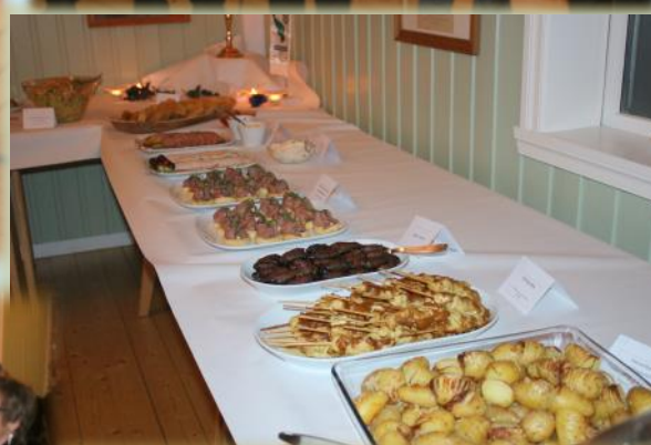
Tapasretter på menyen