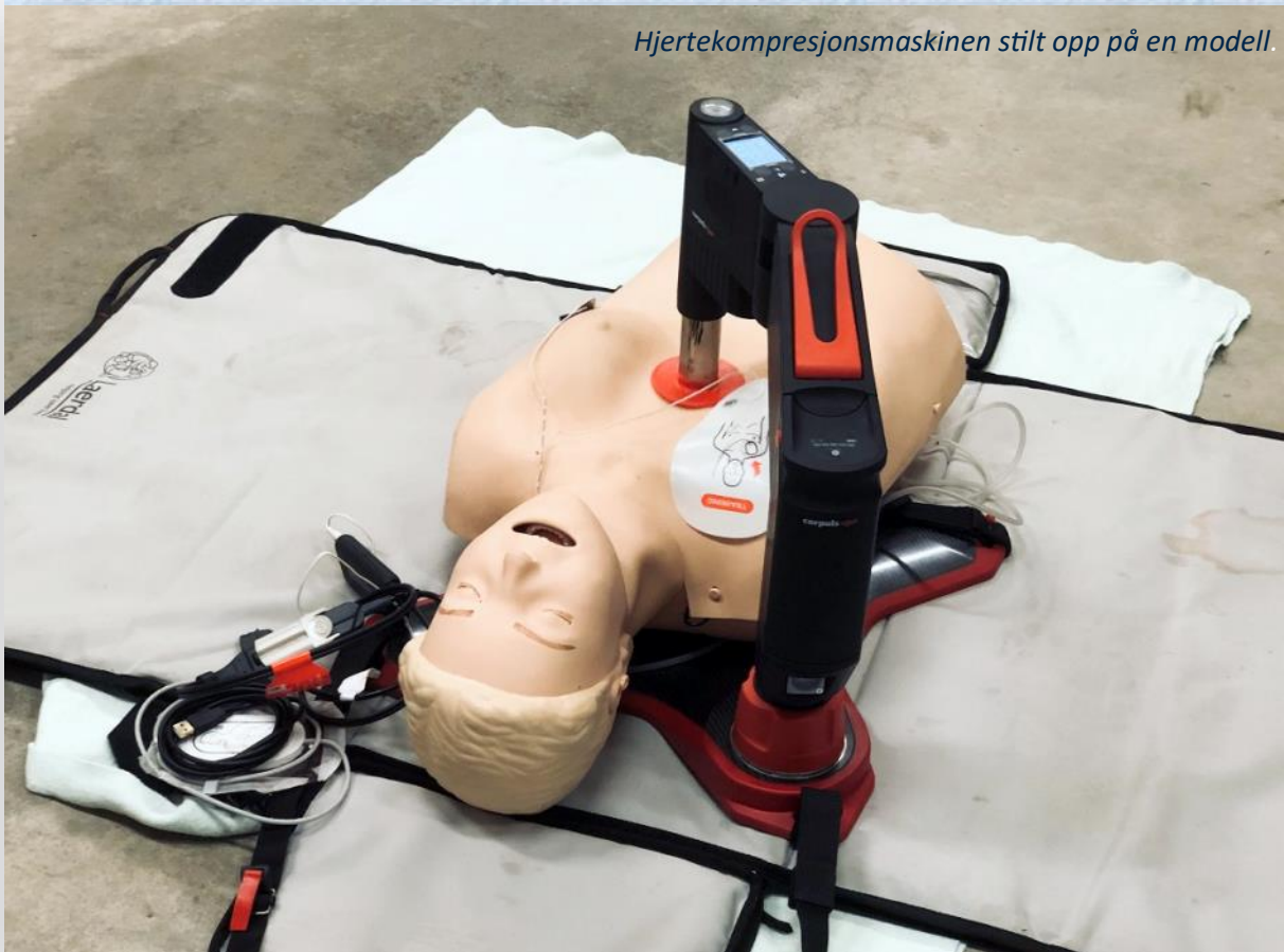
Hjertekompresjonsmaskinen stilt opp på en modell.

Som tidligere beskrevet i Rotary i Vest, har Karmøy Vest Rk hatt flere gode prosjekter både lokalt og internasjonalt. Med dette prosjektet kunne klubbene vise at Rotary også var opptatt av menneskene i hele vår lokale region. Vi tok derfor imot utfordringen med glede og entusiasme og gjorde avtale med Kopervik og Karmøy Rotaryklubb om å gjøre prosjektet til et felles Rotaryprosjekt med Karmøy Vest Rk i ledelsen.