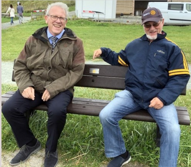
Bilde 4: Guvernøren og AG3

Guvernørens hilsen til klubben under festen ble satt stor pris på. Også hans dikt av Olav H. Hauge og å gjøre hverandre «ei beine»,