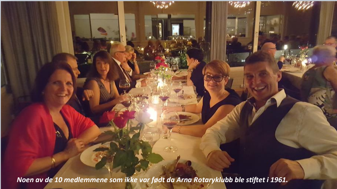
Noen av de 10 medlemmene som ikke var født da Arna Rotaryklubb ble stiftet i 1961.

Alt Tverlid, det eldste tilstedeværende medlem, utbrakte en skål for Rotarys æresguvernør, kong Harald 5.