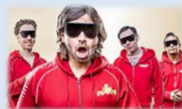
Datarock i kjent stil