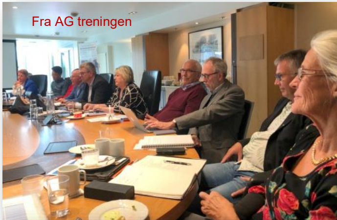
Fra AG treningen