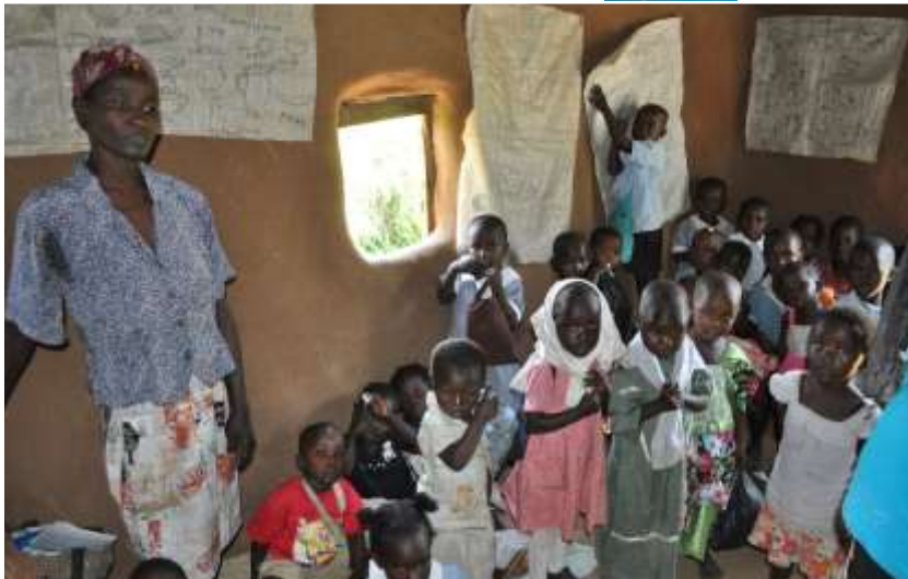
Barnehage uten leker