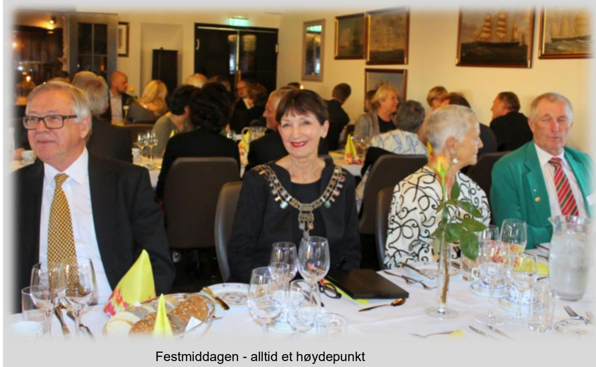
Festmiddagen - alltid et høydepunkt